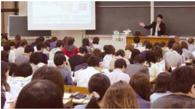
就職活動スタート講座

就職活動をするにあたって、まずは、自分の強みをしっかりと理解し、どの業種や仕事であればその強みが生かせるのかを考えてみましょう。次に、選考から漏れたときにくじけないことも大切です。前向きに、笑顔で忘れずに、就職活動に臨んでほしいと思います。