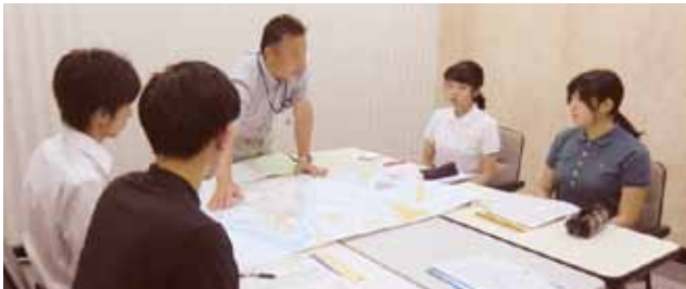
(インターンシップの様子(下関市港湾局))

本学キャリアセンターではこのように変わり続ける就職活動に対応し、学生が希望する企業に就職できるよう支援していきたいと考えています。