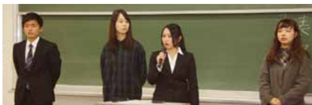
※PBL：Project Based Learning（課題解決型学習）

最も苦戦したのは、本当に商品価値のある旅行プランを提示するために、調べた膨大な情報の中からどれを選択してどのように提示するかを見出す点です。企画を進める中でも、この点についてグループ内で何度も衝突しました。そこで一つの目標を達成するためには、今、何が最適かを見極めることの必要性を学びました。グループの皆がいつも同じ意見であるとは限りません。しかし私たち全員が「プロを納得させることのできるプレゼン」を目指していたので、最終的に一つにまとめることができました。意見の衝突は、どのグループに所属しても生じるものです。その際には、原点となった目標を確認することをこれからも心がけたいと思います。